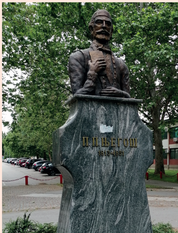
Спомен-биста Петру II Петровићу Његошу која се налази у Универзитетском кампусу у Новом Саду