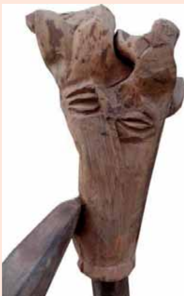
Скулптура (Ф. 202 x 55 x 33 cm)

Ова серија која је изложена, представља по снази, јединствену експресију и шаље снажне етичке поруке.