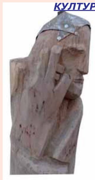
Скулптура (Ф. 150 x 30 x 70 cm)

Његова вајарска дјела у којима се осликава Црна Гора су моћна у приказу и ту можемо слободно