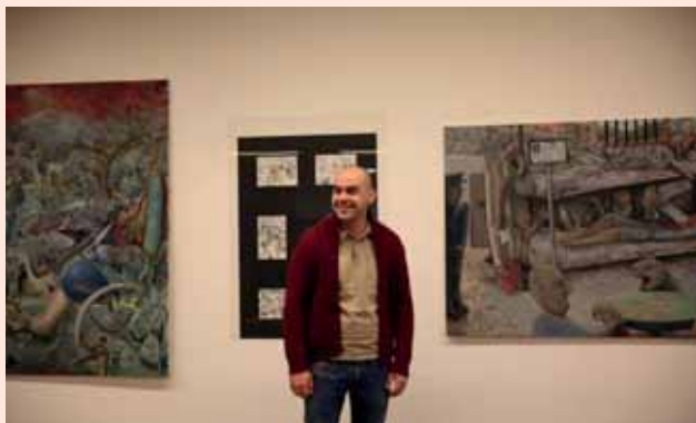
Аутор Мишко Бољевић

УДРУЖЕЊЕ ЦРНОГОРАЦА „ОНОГОШТ“ ИЗ НОВОГ САДА И НАЦИОНАЛНИ САВЈЕТ ЦРНОГОРСКЕ НАЦИОНАЛНЕ МАЊИНЕ БИЛИ СУ ОРГАНИЗАТОРИ ИЗЛОЖБЕ СЛИКА МЛАДОГ ЦРНОГОРСКОГ СЛИКАРА, МИШКА БОЉЕВИЋА.