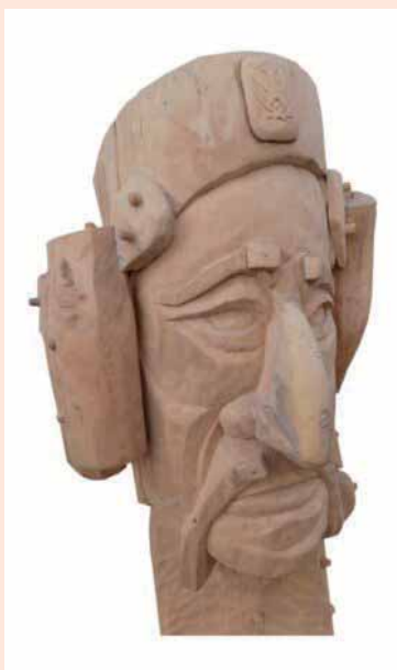
Скулптура (Ф. 101 x 46 x 43 cm)

Изражени скелети брђана, веђе, мрки брци, постају каткада згужвани ликови, притиснути теретом историје и живота. Приказ ликова своди на голу површину, који подсећа на анимирани камени крш родних Сомина, гдје се истиче вриједност за родно и национално, иако његови мотиви прелазе националне границе.