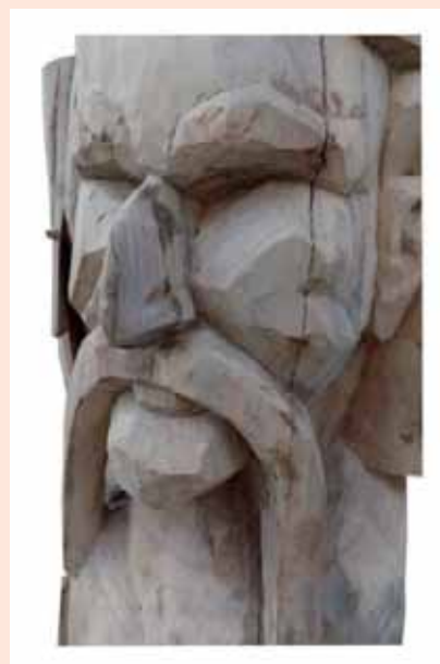
Скулптура (Ф. 164 x 38 x 35 cm)

Навешћу неколико назива изложених скулптура: