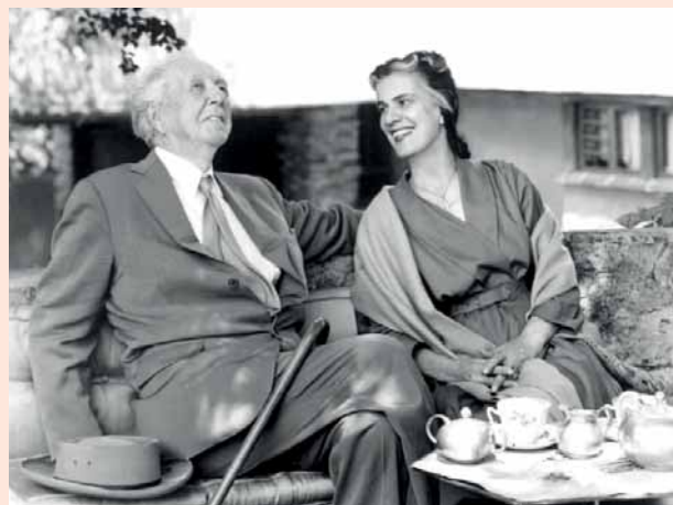
Френклин и Олгивана у Таилесину

У контексту садашњости, Олгино појављивање у Црној Гори би данас изазвало велику пажњу јавности и била би велика ексклузива.