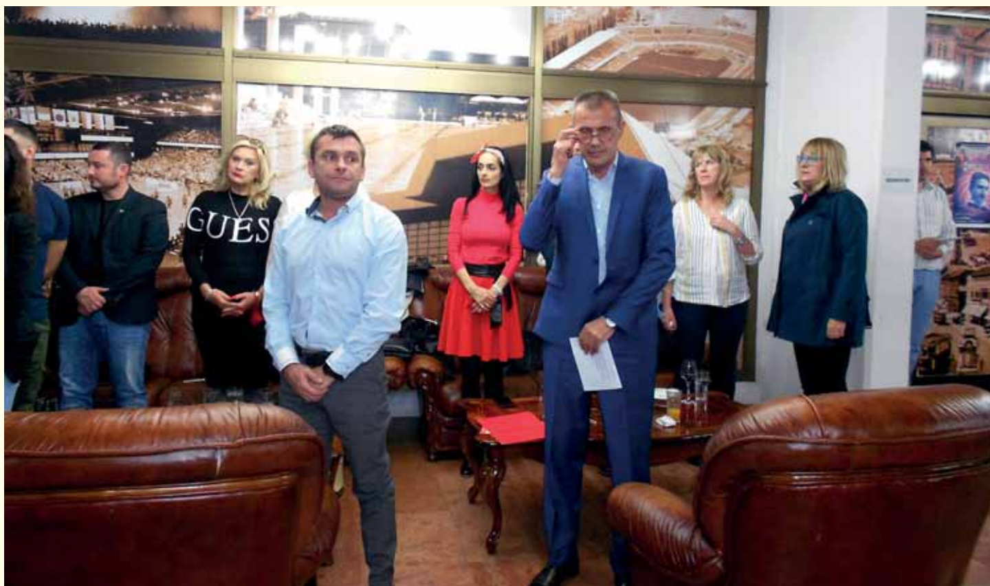
Чланови Националног савјета.