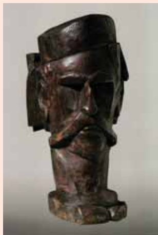
Микајле, дрво, 60x30x30, 2020. године

Реците нам о Вашим почецима, што би рекао Лаза Костић: ”Две се у мени побише силе, мозак и срце, памет и сласт”. Кад је почело ликовно и вајарско стваралаштво, кад су памет и медицина добиле “бој”, а онда нашле заједнички језик и као резултат тога ова импозантна збирка више од 300 радова?