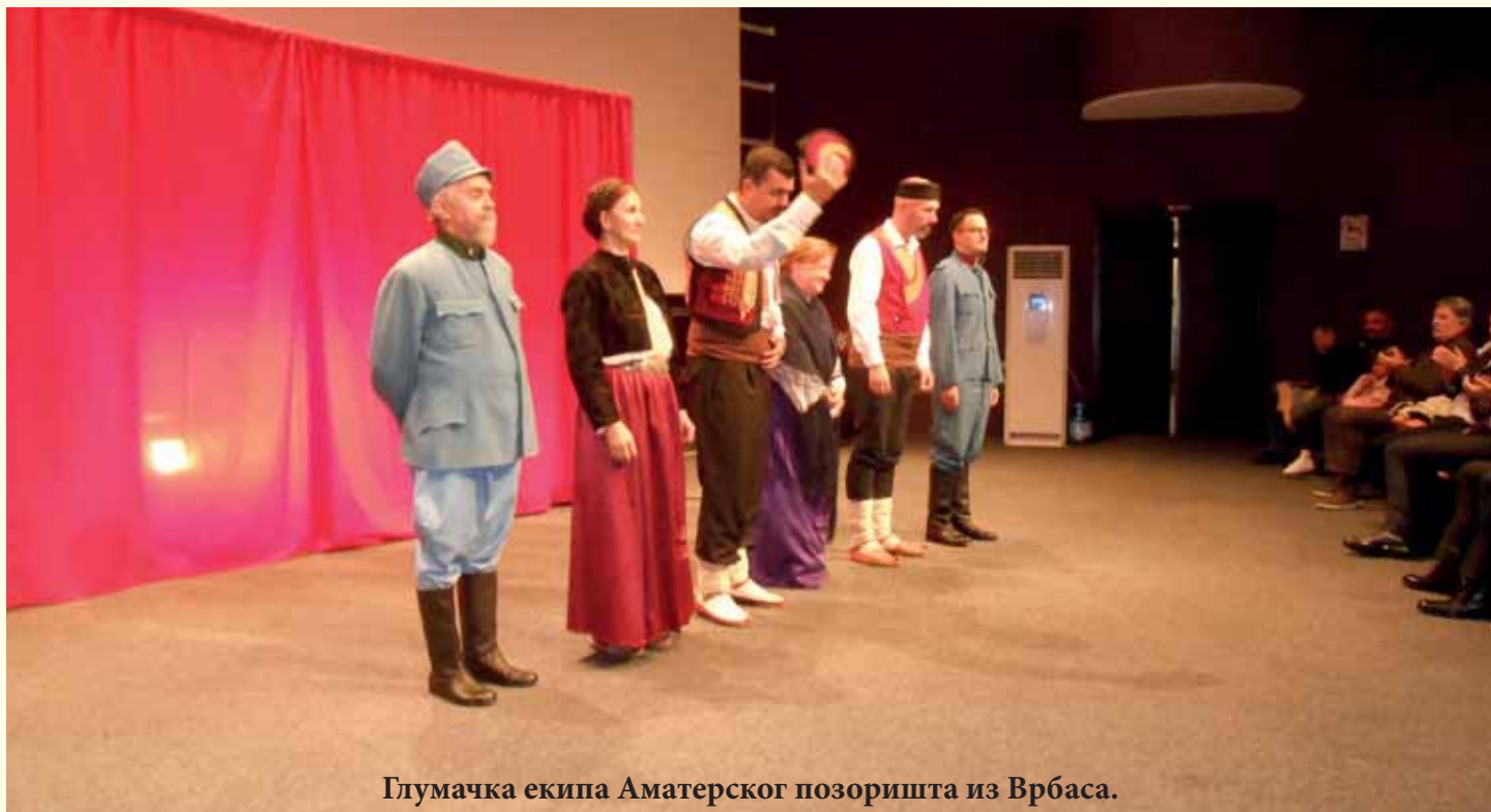
Глумачка екипа Аматерског позоришта из Врбаса.