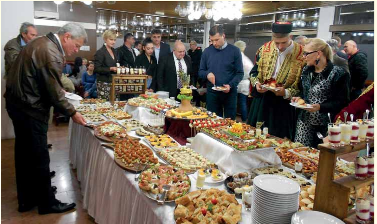
Текст: Редакција "Вијест", Фото: Александра Чубрановић