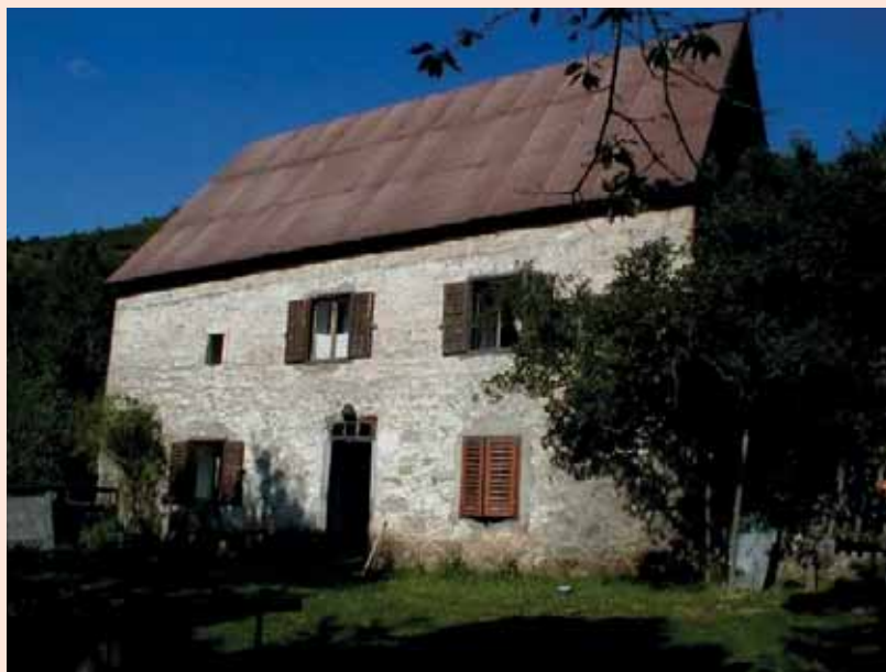
Родна кућа Новице Церовића