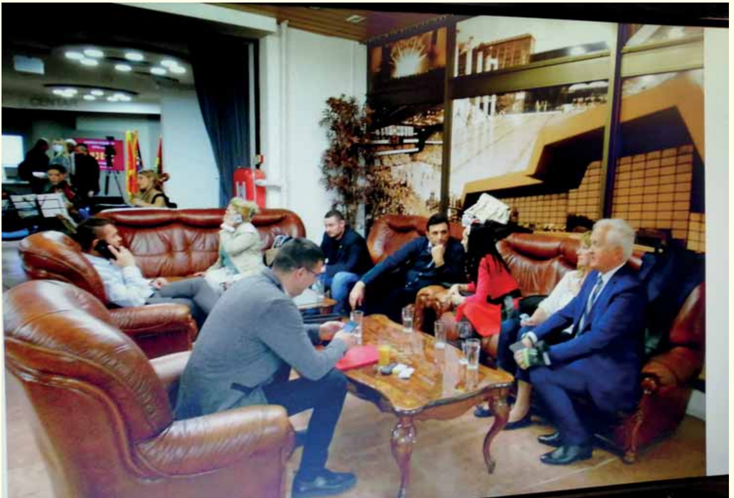
Чланови Националног савјета.