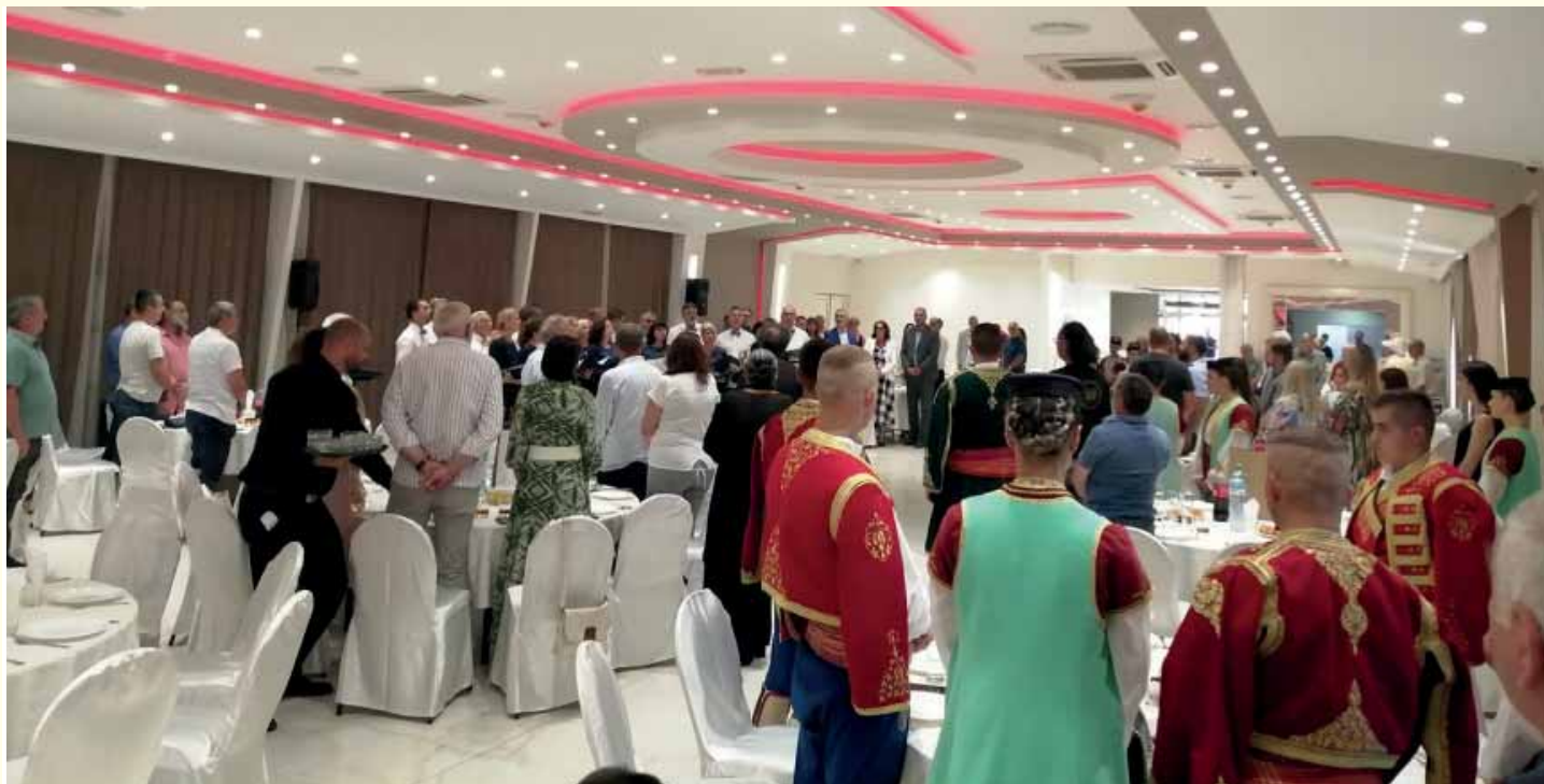
НАЦИОНАЛНИ САВЈЕТ ЦРНОГОРСКЕ НАЦИОНАЛНЕ МАЋИНЕ ОБИЉЕЖИО 13. ЈУЛ - ДАН УСТАНКА У ЦРНОЈ ГОРИ